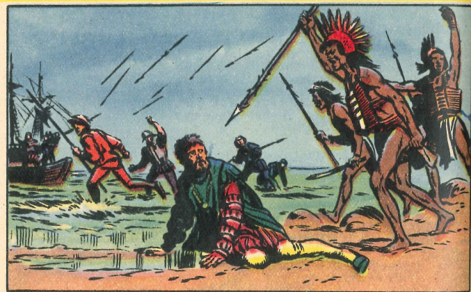
4. — MAGELLAAN

CHRISTOFORUS COLOMBO, in het Spaans Christobal Colón, werd geboren te Genua als zoon van een lakenwever. Hij werd matroos, reisde veel en droomde er van het eiland Antilla te ontdekken en Indië langs het westen te bereiken. In 1492 kreeg hij de steun van de vorsten van Spanje, Ferdinand de Katolieke en Isabella van Castilië, die zo juist Granada hadden ingenomen. Ze gaven hem drie kleine karvelen, de Santa Maria, de Nina en de Pinta. Op 3 augustus 1492 verliet hij met deze schepen en een 120-koppige bemanning de haven van Palos en zelde naar het westen, het onbekende tegemoet.