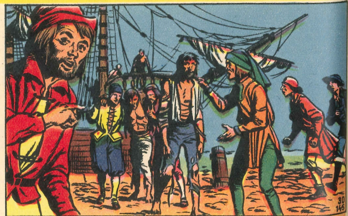
5. — DE REIS ROND DE WERELD

HET logboek van Christoffel Columbus werd bewaard. We weten dat de matrozen doodsbang waren omdat de reis zo lang duurde en zij niets anders zagen dan lucht en water. We weten dat op 12 oktober het land eindelijk in het gezicht kwam. Columbus landde op Guanahani, een van de Bahama-eilanden. Hij had een nieuwe wereld ontdekt, maar hij wist het niet. Christoffel Columbus was er van overtuigd dat hij in Indië was aangekomen!