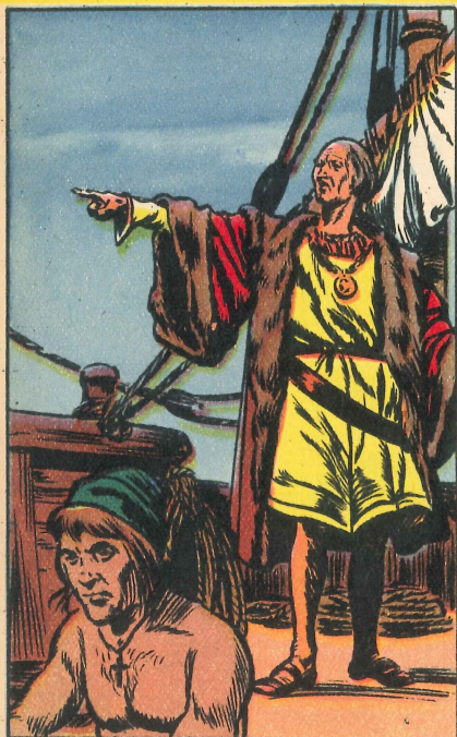
1. — CHRISTOFFEL COLOMBUS

CHRISTOFFEL COLOMBUS keerde triomfantelijk naar Palos terug. Hij deed nog drie reizen over de Atlantische Oceaan, viel dan in ongenade en werd in de gevangenis geworpen. Hij stierf in 1506 en ook toen nog was hij er heilig van overtuigd dat hij Azië had gevonden. Nooit is het tot hem doorgedrongen dat hij de nieuwe wereld had ontdekt! De Florentijn Amerigo Vespucci vermoedde dat het hier om een nieuw kontinent ging en Amerika werd later naar hem genoemd.